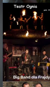
Teatr Ognia godz. 22.15