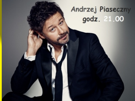
Andrzej Piaseczny godz. 21.00