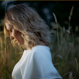
Marika godz. 19.30