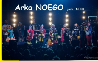
Arka NOEGO godz. 16.00

Na błoniach przed Urzędem Gminy w Lesznowoli