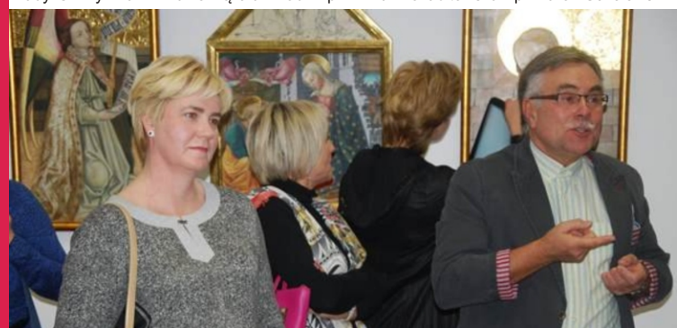
Na ścianach naszej Galerii Wystaw Artystycznych OKNO prace studentów ASP prezentowały się wspaniale, rozmowom i opowieściom o sztuce nie było końca.